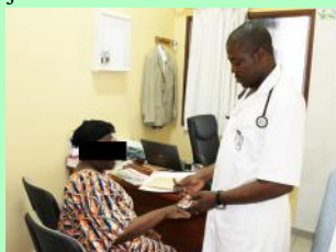
Scène de dépistage du diabète.