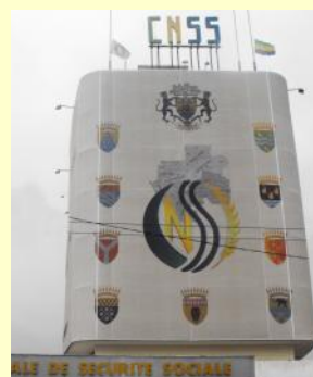
CNSS: horizon 2011-2015 défini

Le 25 octobre 2010, le directoire de la CNSS devrait se retrouver pour faire le point d'avancement des plans d'actions 2010, proposer des objectifs cohérents avec les axes de la note d'orientations stratégiques 2011-2015; proposer un plan d'actions annuel 2011 par processus; choisir des indicateurs parmi ceux présentés par le contrôle de gestion, y ajouter d'autres si nécessaires; établir les axes budgétaires cohérents avec votre plan opérationnel 2011.