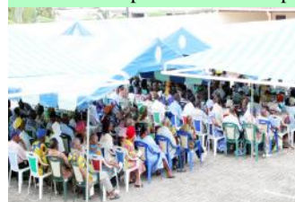
Une vue partielle des retraités venus très nombreux

Les témoignages reçus dressent un satisfecit d'ordre général en terme de qualité de service: accueil des retraités, distribution des dépliants conseils pour se prémunir, visites médicales et remise des ordonnances, distribution des médicaments à la pharmacie de la PMSGA, examens complémentaires si nécessaire. Témoignages: