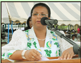
Mme le Directeur Général prononçant son discours de circonstance

Le 1er mai dernier, l'esplanade de l'immeuble Batavéa a servi de cadre aux festivités marquant la traditionnelle Fête du Travail qu'organise la Direction Générale à l'intention de l'ensemble du personnel. En effet, après avoir pris part au défilé marquant cet événement, devant la tribune officielle du Boulevard de l'Indépendance, le personnel et les membres de la Direction Générale se sont rassemblés dans un élan familial, pour célébrer cette manifestation