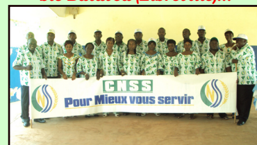
ceux des structures délocalisées comme ici à Lastourville ont célébré ensemble le 1er mai