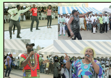
A l'instar des agents du siège, ici à l'esplanade de l'immeuble Batavéa (Libreville)...